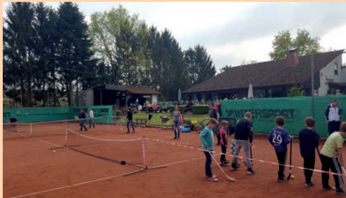
„Deutschland spielt Tennis“-Aktion im Jahr 2016