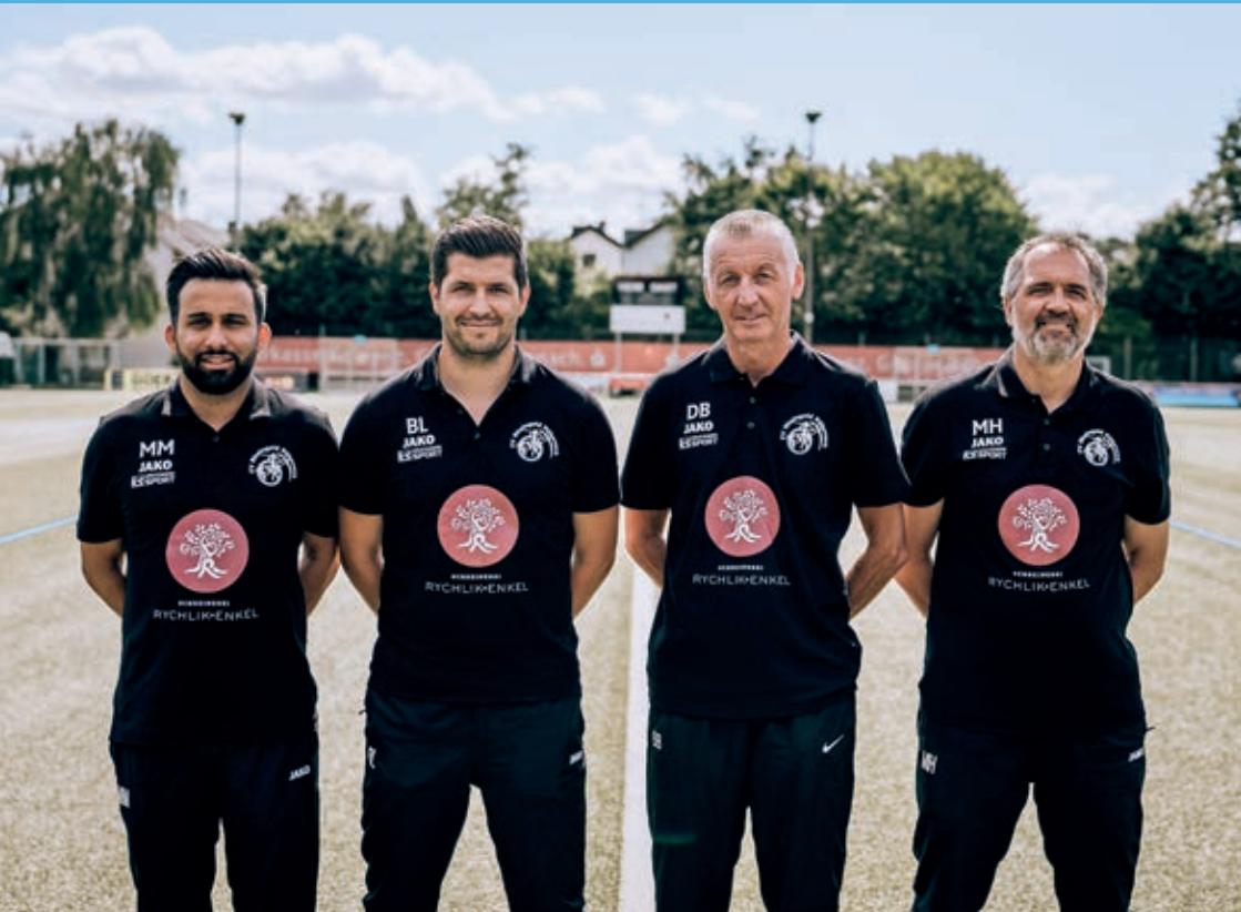
Das Trainer-Team der 1. Herren-Mannschaft

Nach der Corona-bedingten Pause seit dem 24.10.2020 startete die 1. Mannschaft nach mehr als sieben Monaten fußballfreier Zeit in die Vorbereitung. Leider musste die Mannschaft einzelne Abgänge, teilweise auch noch sehr kurz vor dem Ende der Wechselfrist, hinnehmen. Der Stamm der Mannschaft bleibt jedoch zusammen. Ebenso geht der Verein mit dem gleichen Trainerteam wie im letzten Jahr in die neue Spiel-