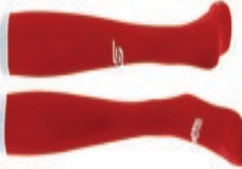
CS ONE Soccer Socks AGA-1654 XS-XL 7,90€