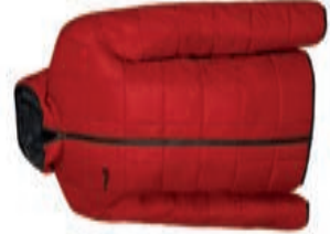
BASICS Reversible Light Weight Jacket AGA-2735 AGA-2736 XS-XL S-XL 69,90€ 79,90€