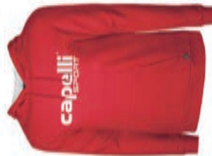
LOGO Hoodie AGA-2215X AGA-2216X XS-XL S-XL 34,90€ 39,90€