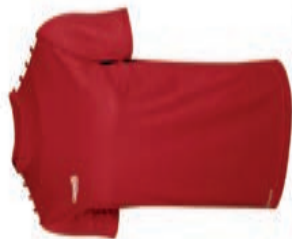
CS ONE Short Sleeve Jersey AGA-2888X AGA-2888X M-XL S-XL 12,90€ 14,90€