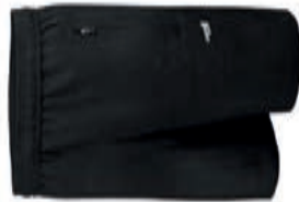
BASICS Women Shorts with Pockets AGA-1248X AGA-1248X XS-XL 24,90€ 25,90€