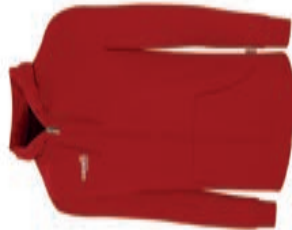
BASICS Zip Hoodie AGA-2088X AGA-2087X M-XL S-XL 34,90€ 39,90€