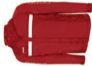
SPARRÖV Rain Jacket AGA-2175X AGA-2180X XS-XL S-XL 49,90€ 59,90€