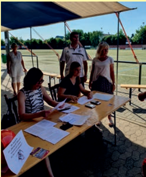
Registrierung durch Praxisteam Dr. Steinkamp

der auf der Tribüne verbringen oder sich einen Schattenplatz auf dem Sportplatz suchen. Während dieser Wartezeit versorgte der Verein die Wartenden mit reichlich Wasser und durch die Anwesenheit der Mitarbeiterinnen der Lindenapotheke Rübenach konnte auch der digitale Impfnachweis unmittelbar erstellt und ausgehändigt werden.