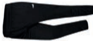
BASICS Training Pants AGA-2510SE AGA-2510SE XS-XL 27,90€ 29,90€