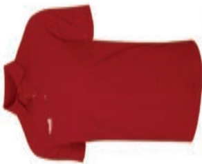
BASICS Cotton Polo AGA-2086X AGA-2086X M-XL S-XL 29,80€ 34,90€