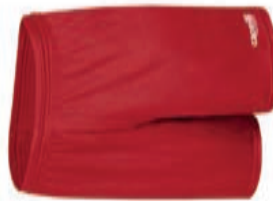
CS ONE Match Shorts AGA-1366X AGA-1367X XS-XL 12,90€ 14,90€