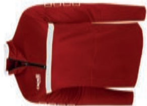
SPARROW 1/4 Training Top AGA-5900X AGA-1801X M-XL S-XL 39,90€ 44,90€