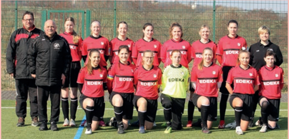
2. Frauen-Mannschaft des FV "Rheingold" in der Saison 2021/2022