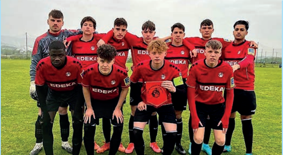
B-Junoren-Mannschaft des FVR beim internationalen Turnier in Spanien

die Betreuer hervorheben, die zu 100% immer dabei waren, ohne die wäre es nicht möglich gewesen. Auch geht der Dank an den Verein, an die Jugendstiftung, an die Fördergemeinschaft und an unsere privaten Unterstützer, die uns finanziell unter die Arme gegriffen haben, sodass auch alle Spieler mitkommen konnten!