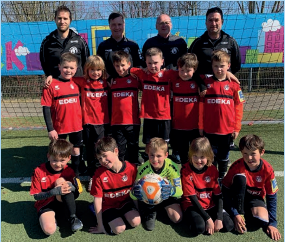
F-Junioren-Mannschaft des FVR

Bei herrlichem Sonnenschein konnten wir am Samstag, dem 19. März insgesamt 15 Mannschaften als unsere Gäste begrüßen. Auf insgesamt drei Spielfeldern wurden den zahlreichen Zuschauern einige schöne Spiele und viele tolle Tore geboten. Bei allem