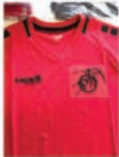
Uptown V Neck inkl. FVR Logo

Adult: 400-27810, 600-27810, 000-000, 11,99€/12,99€