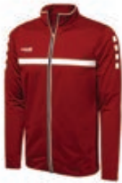
Sparrow Training Jacket/Shirt inkl. FVR Logo