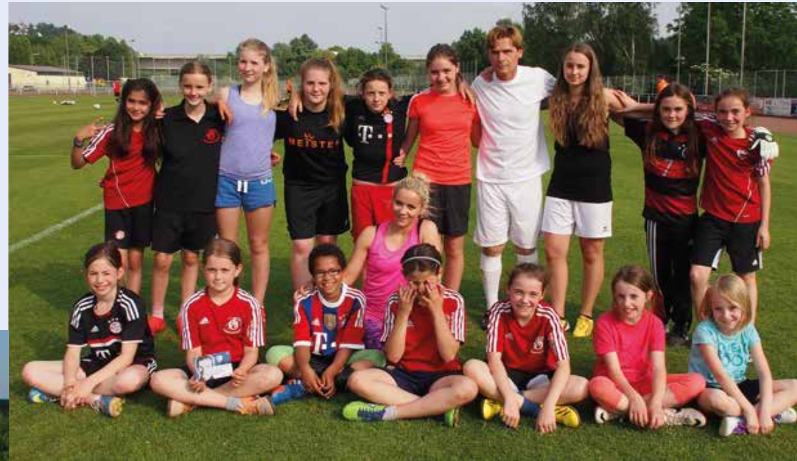
Ex-Nationalspieler Dariusz Wosz mit den E- und D-Juniorinnen des FVR

Frauen- und Mädchenfußball in Rübenach verbunden ist, waren die E- und D-Juniorinnen unseres Vereins zum Vorprogramm in das Rheinstadion eingeladen. Hier erlebte der weibliche Fußball-Nachwuchs ein Training mit dem Ex-Nationalspieler Dariusz Wosz vom VfL Bochum oder konnte sich für ein Cheerleader-Training mit dessen Ehefrau entscheiden. Zum Hauptspiel des Abends, einer Partie einer Bendorfer-AH-Auswahlmannschaft gegen die sportlich starke Lotto-Elf (Endstand: 1:9), liefen unsere E-Juniorinnen dann vor 450 Zuschauern mit auf das Feld ein – natürlich nicht, ohne sich im Vorfeld diverse Erinnerungsfotos mit den Trainern Horst Eckel (Weltmeister von 1954) sowie Hans-Peter Briegel (Vize-Weltmeister von 1986) und den Spielern wie Wolfgang Overath (Weltmeister von 1974) oder Guido Cantz (Versteckte Kamera) zu sichern. Der, in der Halbzeitpause an die Elterninitiative krebskranker Kinder überreichte Spenden-Scheck in Höhe von 7.000 Euro – die Lotto-Elf läuft ausschließlich kostenlos und nur für soziale Zwecke auf – rundete das Abendprogramm ab, welches nicht nur unseren Rübenacher Fußballerinnen noch einige Zeit in angenehmer Erinnerung bleiben dürfte.