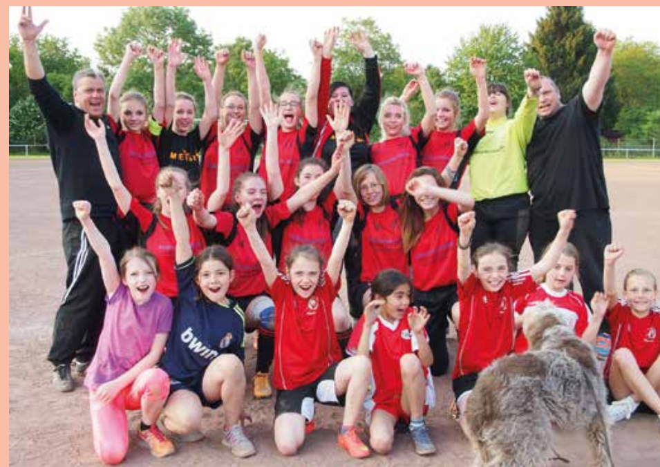
B-Juniorinnen (mit E-Mädchen-Fans)