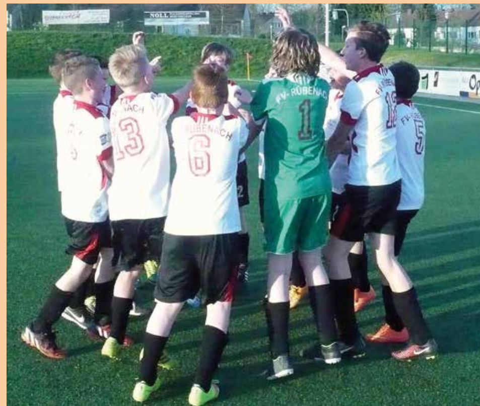
Humba: Große Freude nach dem 3:1 Sieg im Viertelfinale bei VfR Koblenz