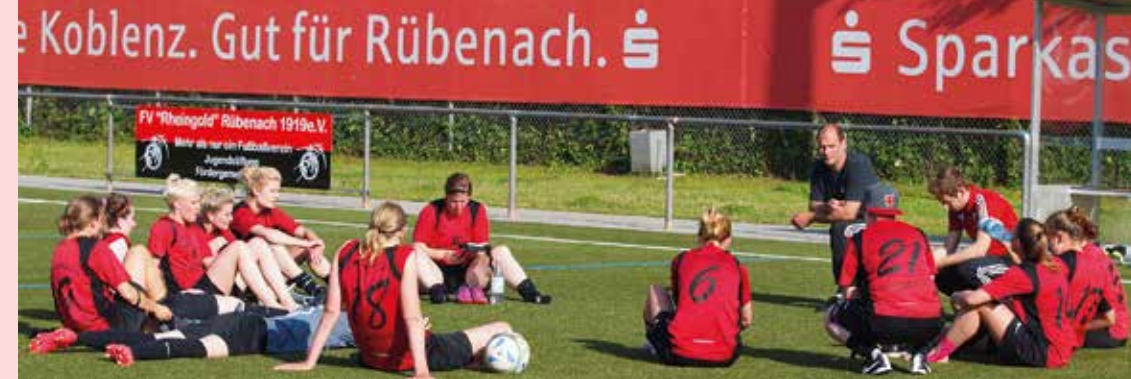
1. Frauen-Mannschaft des FV "Rheingold" Rübenach

Zwischendurch, mitten in der Saison, gibt es eine nahezu fußballlose Zeit. Die Winterpause. Das ist schon kein Zwischendurch mehr. Bei schönem Wetter ruht der Ball, ok, in der Halle wird bei Kreismeisterschaften und Rheinlandmeisterschaften etwas gekickt. Bis die geliebte Vorbereitung wieder startet. Da sind sie wieder ... weg, die oben beschriebenen motorischen Grundeigenschaften. Nach einem gefühlten Vierteljahr Pause müssen sie wieder gefunden werden und das bei Graupel oder Minusgraden. So ist das. Den Spielerinnen wird warm, den Trainern kalt. Dafür waren vorher die Köpfe heiß – Trainingsplanung, Vorbereitungsspiele, Mannschaftsaufstellungen, Material, etc.. Und das natürlich weiterhin auch immer zwischendurch.