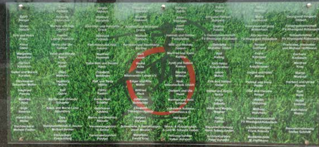
Neu angebrachte Spendentafel am Clubheim des FV "Rheingold" Rübenach