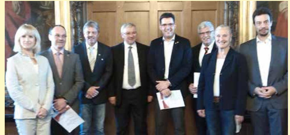
Die ausgezeichneten Rübenacher Ehrenamtler mit politischen Vertretern der Stadt Koblenz