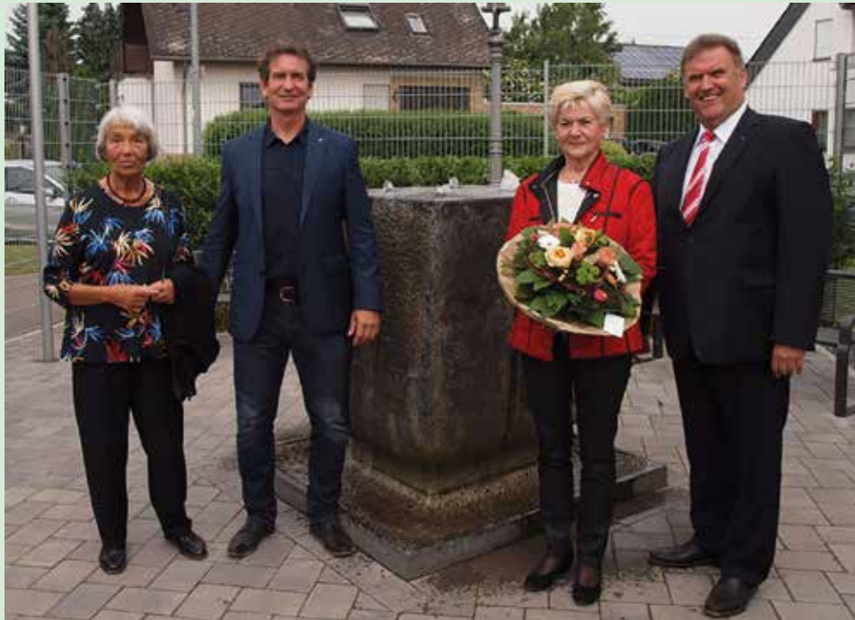
Zum Gedenken an unseren Gründer der Jugendstiftung – Reinhard Dötsch- wurde der neue Standort des Brunnens „Reinhard-Dötsch-Platz“ benannt.