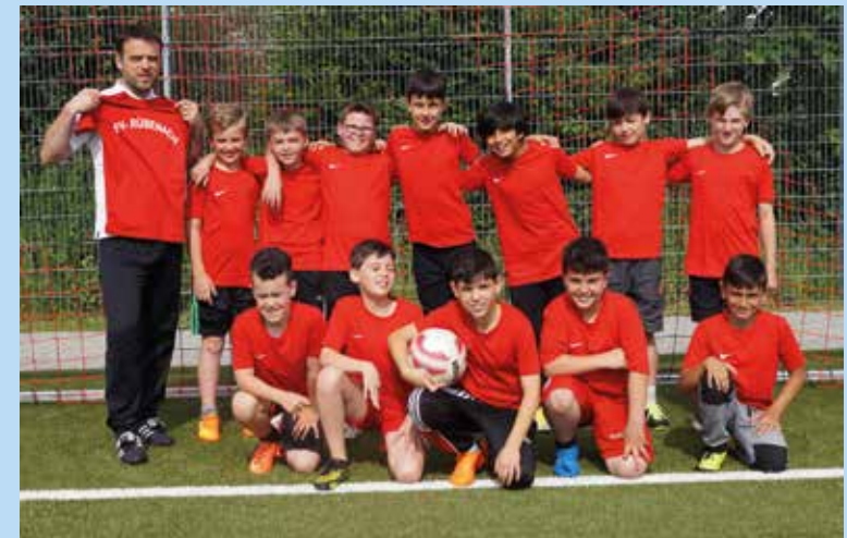
E3-Junioren des FV "Rheingold" Rübenach