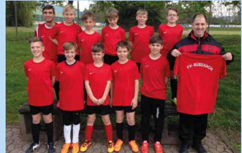
E2-Junioren des FV "Rheingold" Rübenach