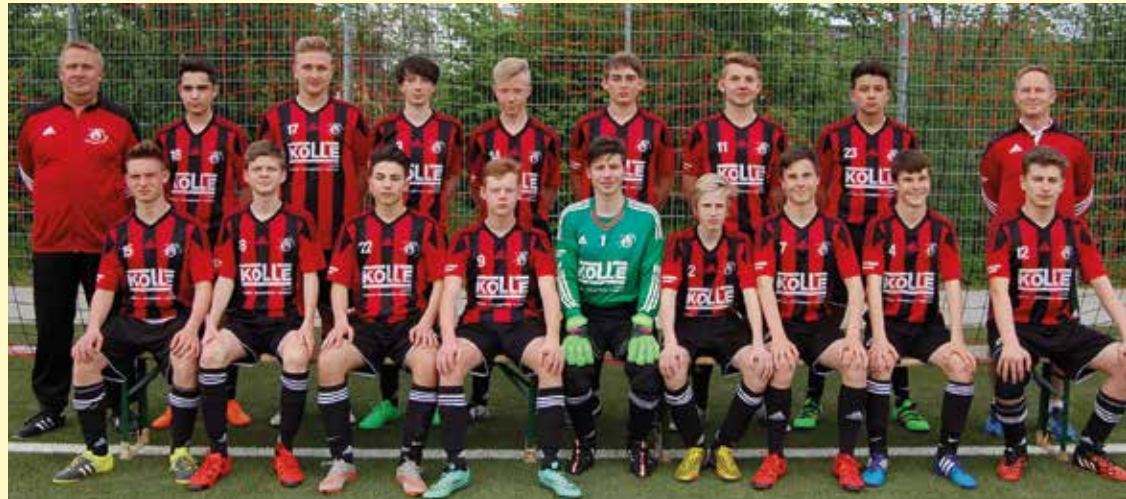
B-Junioren des FV "Rheingold" Rübenach in der Saison 2015/2016