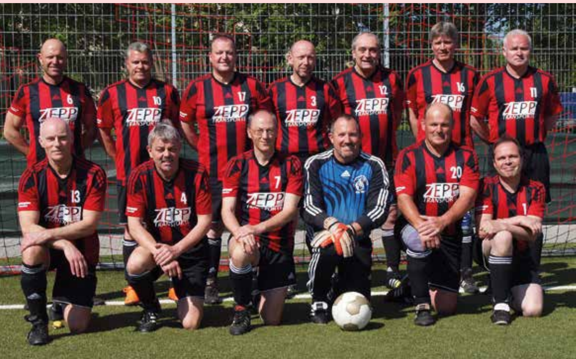
Alten Herren - Ü50-Mannschaft des FV "Rheingold" Rübensch

Diese Rheinlandmeisterschaften sind zudem Qualifikationsturniere zur Regionalmeisterschaft Südwest, welche dann den jeweiligen Regionalmeister und Vize-Regionalmeister zur Teilnahme an der Endrunde beim DFB Ü 40 / Ü 50 – Cup 2016 berechtigen.