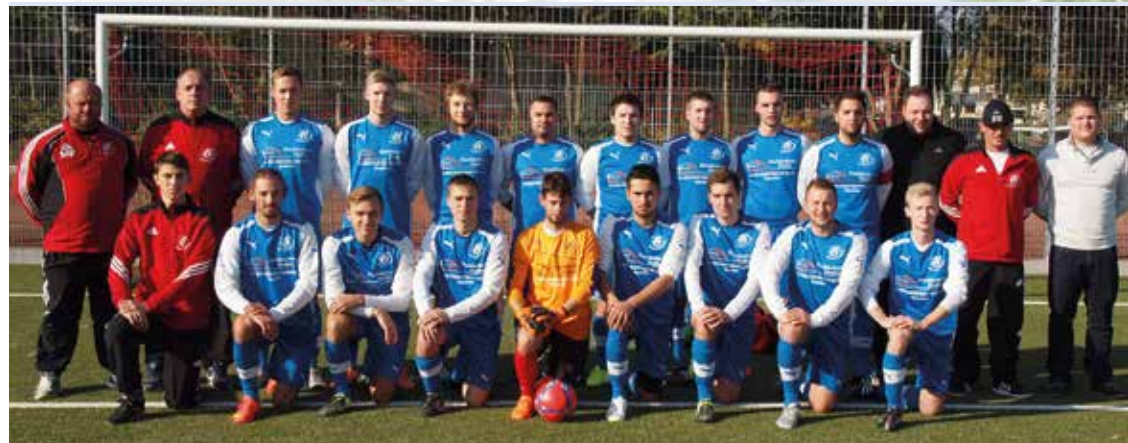
2. Herren-Mannschaft des FV "Rheingold" Rübenach