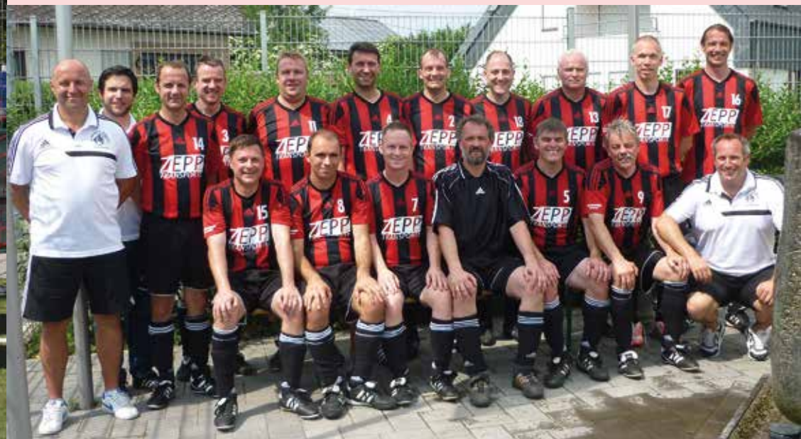
Alten Herren - Ü40-Mannschaft des FV "Rheingold" Rübensch

Ein riesiges Dankeschön an alle die zur gelungenen Durchführung dieser beiden Turniere beim FV Rheingold Rübensch beigetragen haben.