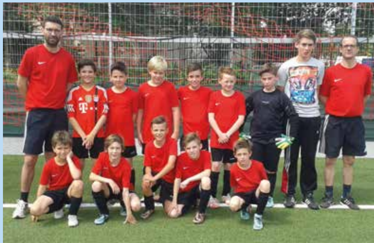
E1-Junioren des FV "Rheingold" Rübenach