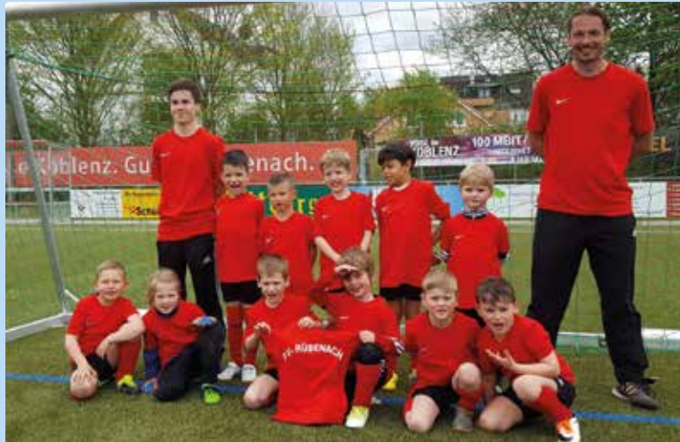
Bambinis des FV "Rheingold" Rübenach

Nicht nur, dass die Jungs die Shirts sehr gerne beim Training tragen, konnte ein tolles einheitliches Bild beim Aufwärmen vor den Spielen gezeigt werden. Man merkte den