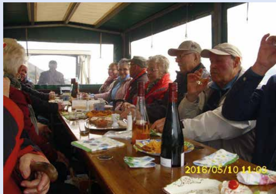
Planwagen-Fahrer am 01. Mai 2016