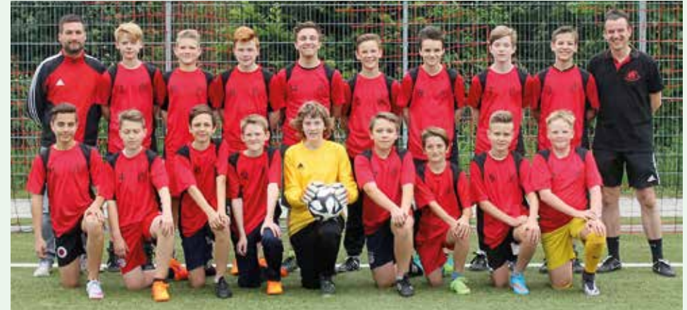
C-Junioren des FV "Rheingold" Rübenach in der Saison 2015/2016

welchem wir uns letztlich trotz eines überragenden 5:1 Sieges über Rhens am letzten Spieltag geschlagen geben mussten. Am Ende fehlte ein einziger Punkt zum Staffelsieg. Man erreichte tolle 30 Punkte mit einem Torverhältnis von 44:21!