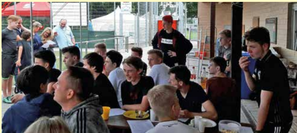
Abschluss-Grillen der Mannschaft im Juni 2016