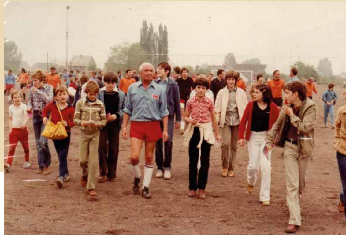
Sportschau-Moderator Ernst Huberty unringt von Rübenacher Autogrammjägern

Westdeutschen Rundfunks (WDR) nach Rübenach zu einem Freundschaftsspiel gegen die Alten Herren des FV „Rheingold“ zu verpflichten. Viele bekannte Persönlichkeiten aus Funk und Fernsehen, an der Spitze der Sportreporter Ernst Huberty, die Schauspieler und Moderatoren Max Schautzer, Werner Zimmer und viele andere mehr waren hier zu Gast. Auf Rübenacher Seite die bekannten Größen der 60er und 70er Jahre. Bewusst veröffentlichen wir diesmal kein Bild der Mannschaften, sondern ein Foto, das überwiegend die damaligen Zuschauer, insbesondere Jugendliche und Heranwachsende zeigt. Na, wer war denn damals schon dabei?