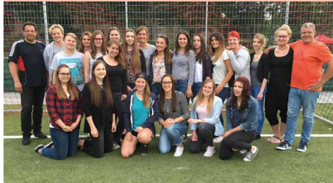
2. Frauen-Mannschaft des FV "Rheingold" Rügenach

Die 2. Frauenmannschaft des FV Rheingold Rügenach hat die Saison 2015/16 mit 9 Siegen, 2 Unentschieden und 9 Niederlagen in der Bezirksliga Mitte auf einem guten 6. Platz von insgesamt 11 Mannschaften abgeschlossen. Toll herausgespielten Siegen standen dabei einige knappe aber auch einige leider deutliche Niederlagen gegenüber. Insgesamt war die Saison für alle, Spielerinnen und Trainer, nicht immer einfach. Viele haben mit Ausbildung und Studium begonnen, so dass sich das Leben auch außerhalb des Sports deutlich geändert hat. Da mittlerweile viele Spielerinnen auch weiter entfernt studieren oder arbeiten, war es vor allem im Trainingsbetrieb nicht immer leicht, eine ausreichende Zahl an Spielerinnen vor Ort zu haben. Auch bei den Spielen gab es den einen oder anderen personellen Engpass, die aber durch großes Engagement immer wieder ausgeglichen werden konnten. Der enge Zusammenhalt innerhalb der Mann-