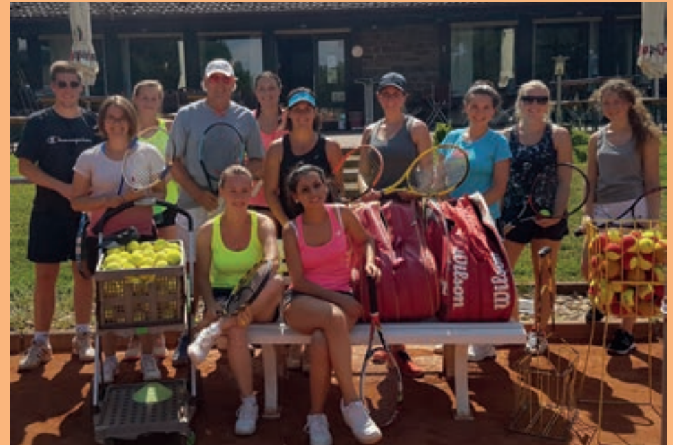
Trainingsgruppe der Uni Koblenz