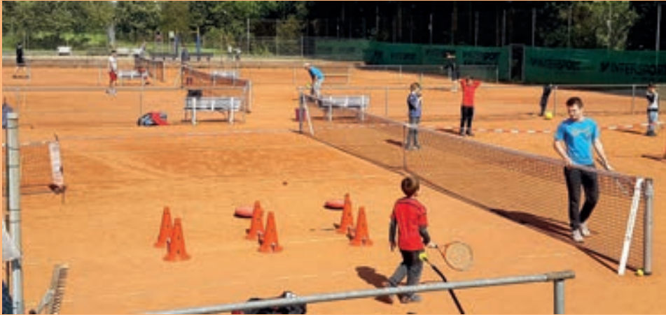
Tennis - Kindertraining