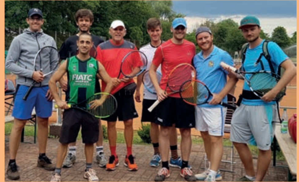
Das Team "Herren 30" nach dem Sieg im Lokalderby gegen Metternich