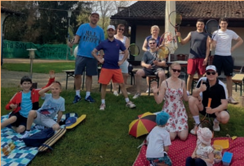
Tennis als Familiensport