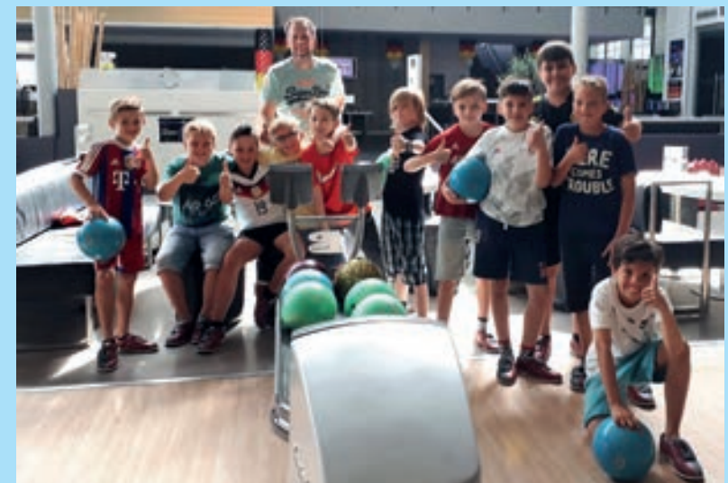
Saisonabschluss im Bowlingcenter