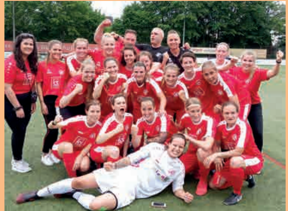
Die 1. Frauen-Mannschaft des FVR nach dem Sieg im Spitzenspiel gegen die SG Fidei