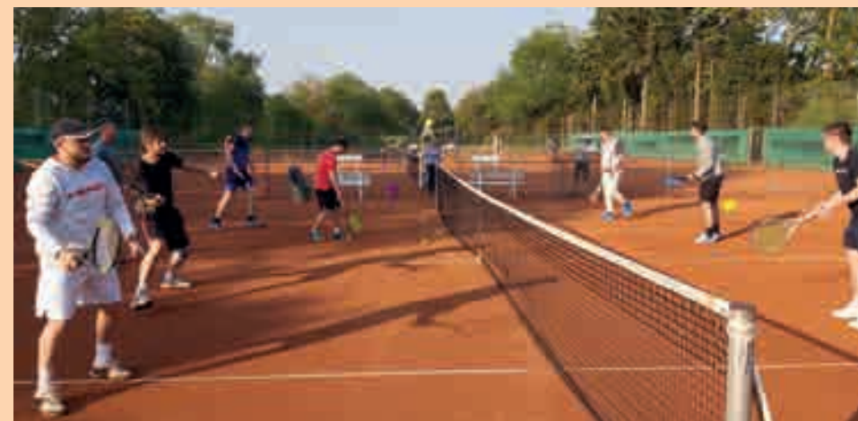
Herren-Training auf der Vereins eigenen Tennisanlage in Koblenz-Rübenach.