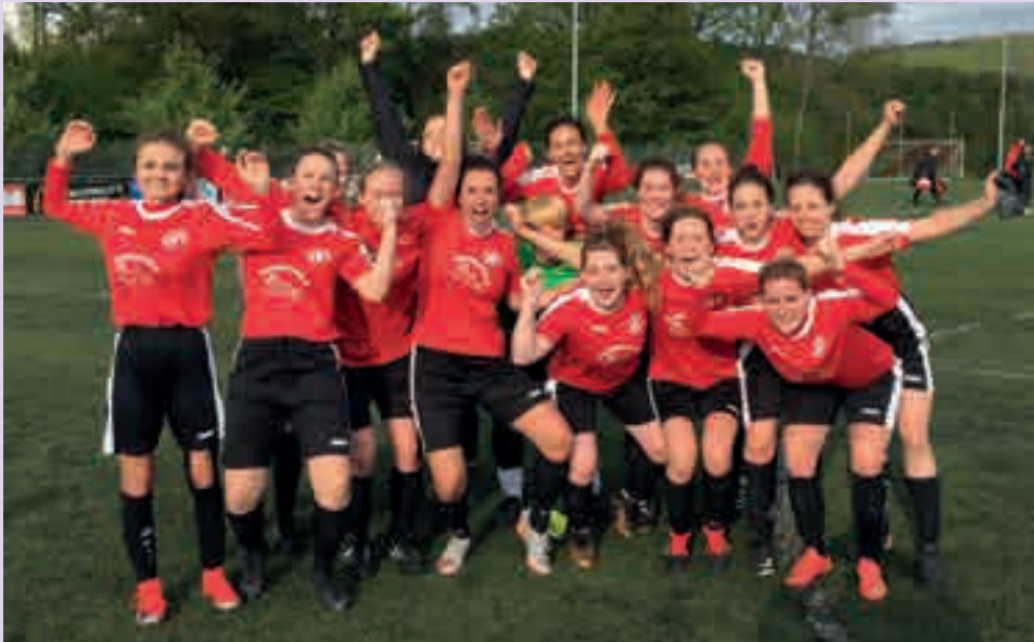
Das Team feiert den Auswärtssieg in Immendorf