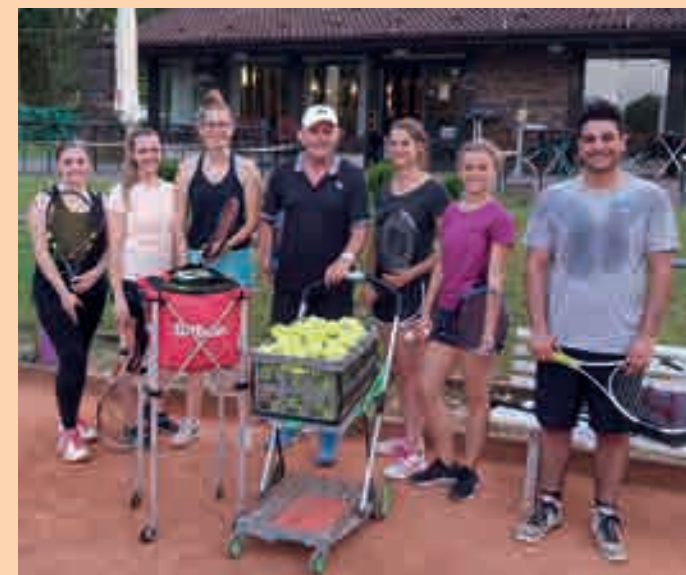
Auch eine Studentengruppe der Uni Koblenz spielt Tennis auf der Rübenacher Anlage.