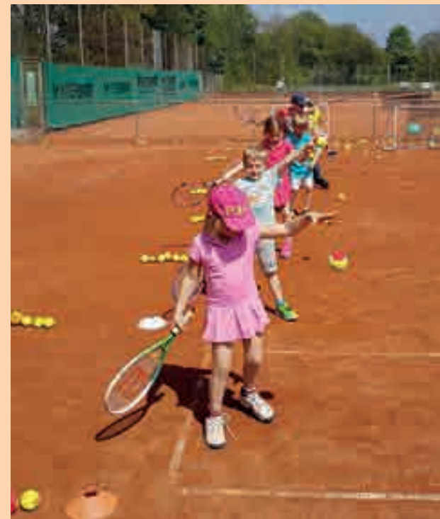
Kinder-Schnuppertraining auf dem Tennisgelände in Rübenach