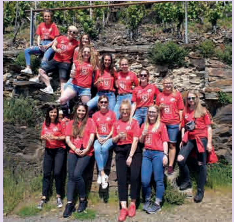
Gibt auch in den Weinbergen ein gutes Bild ab: Die 2. Frauen-Mannschaft des FV „Rheingold“ Rügenach.

Zum offiziellen Saisonabschluss traf sich das Team dann noch Ende Mai zu einer Planwagenfahrt durch die Gewinner Weinberge, ehe es zum Abschluss-Grillen auf das Rügenacher Sportgelände ging.