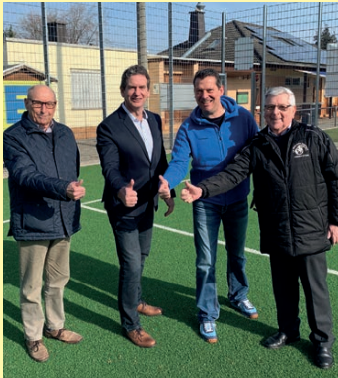
Gremien-Mitglieder der Jugendstiftung