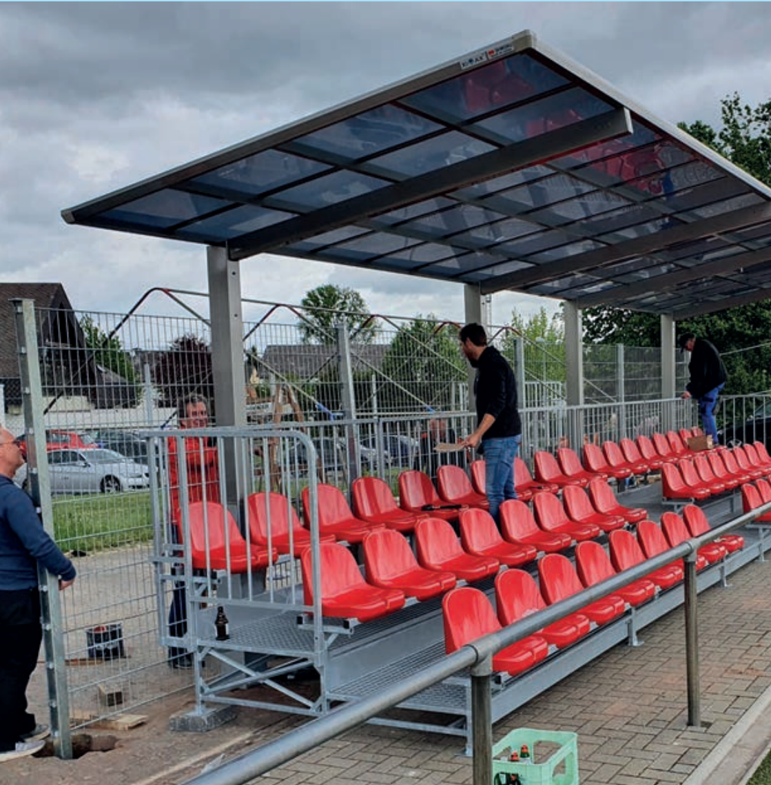
Die neue Sitzplatz-Tribüne wird auf dem Sportplatz des FV "Rheingold" montiert.