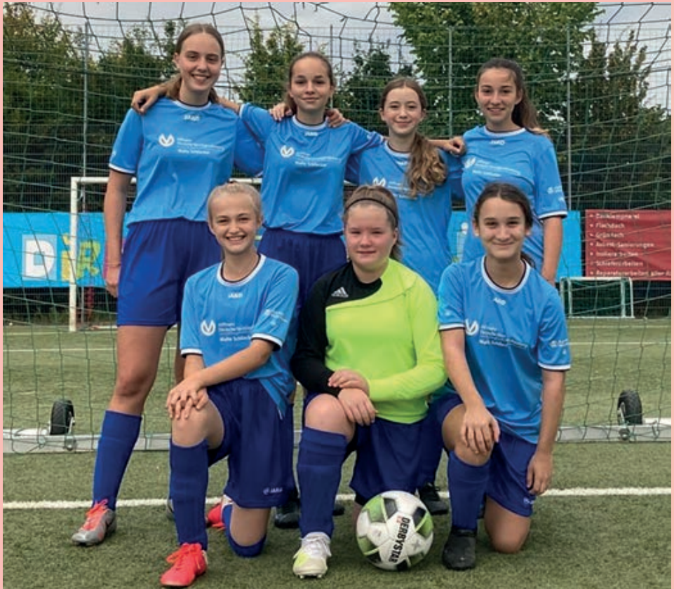
C2-Juniorinnen des FV "Rheingold" im Spieljahr 2021/2022

wieder in Führung und verteidigte diese bis zum Abpfiff. Besser lief es bei der C 2, die einen ungefährdeten 3:0-Sieg gegen den TV Kruft einfuhr. Am dritten Spieltag standen die C 2-Mädchen gegen den stark gestarteten SV Holzbach auf dem Platz. Dieses Spiel ging denkbar ärgerlich mit 1:2 aus. Besser lief es bei der C 1, die in Andernach mit 1:0 als Sieger vom Platz ging. Am vierten Spieltag musste die C 1 gegen den Tabellenführer aus Neuwied antreten. Allerdings waren die Mädchen sehr gut vorbereitet, so dass die Zuschauer an einem schönen Samstag einen souveränen 3:0-Heimsieg geboten bekamen und das Team vorerst die Tabellenführung übernommen hat. Die C 2 beendete den Spieltag gegen die MSG Leienkaul mit 4:0 und steht damit nun solide im Mittelfeld!