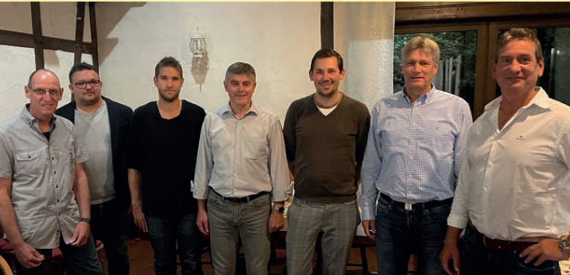
Der Vorstand des FV "Rheingold" Rübenach 1919 e.V.

In der ersten Mitgliederversammlung, die durch den im letzten Jahr neu gewählten Vorstand durchzuführen war, ging es insbesondere um einen ersten Tätigkeitsbericht. Wie haben sich die neuen Strukturen etabliert? Wie läuft die Zusammenarbeit? Was wurde in dem zurückliegenden Jahr erreicht? Um unter anderem diese Fragen zu beantworten, berichteten die sieben Vorstandsmitglieder einzeln aus ihren jeweiligen