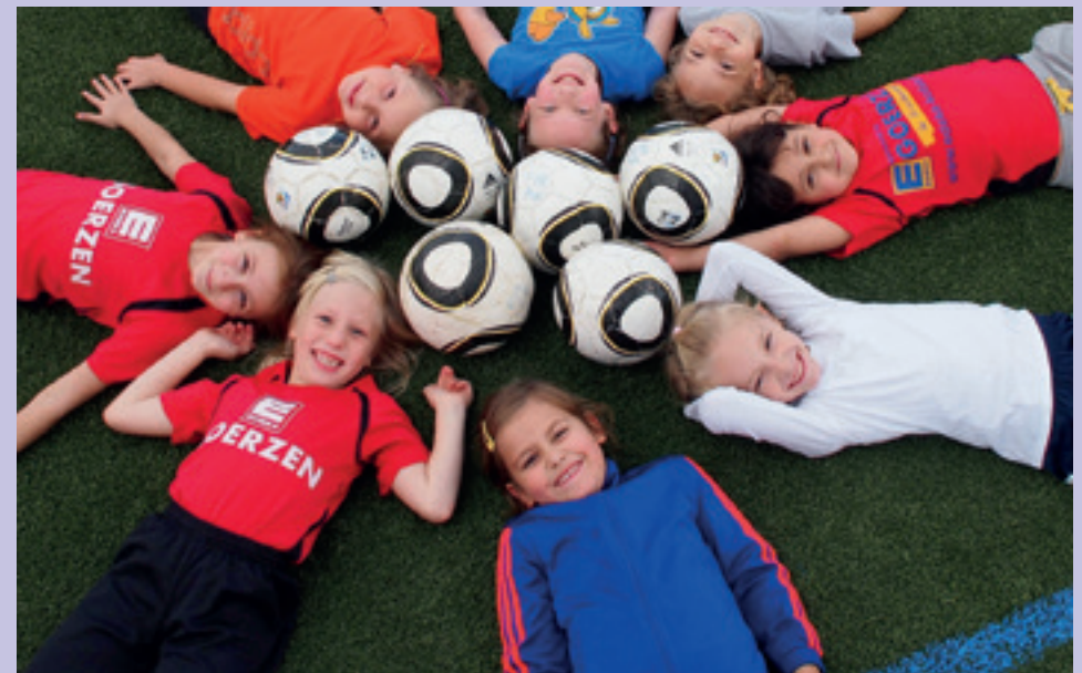
Nur im Trainingsbetrieb: die F-Mädchen des FV "Rheingold"