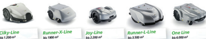
Ciky-Line bis 1.200 m 2