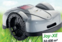
Joy-XE bis 600 m 2