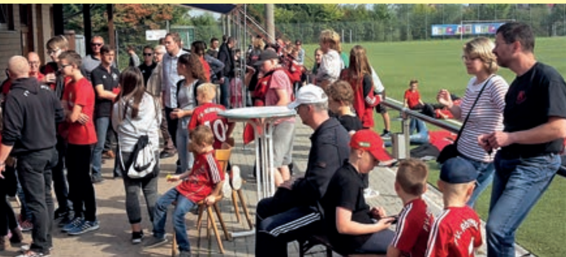
Treffen nach dem Umzug auf dem Sportplatz zur Getränke- und Fahrchip-Ausgabe

Zwecks personeller Unterstützung beteiligte sich unser Verein auch wieder am Thekendienst im Festzelt. Während der Maxi-Playback-Show am Kirmes-Sonntag wurde eine