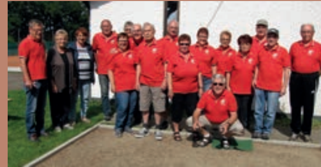
Die Boule – Abteilung