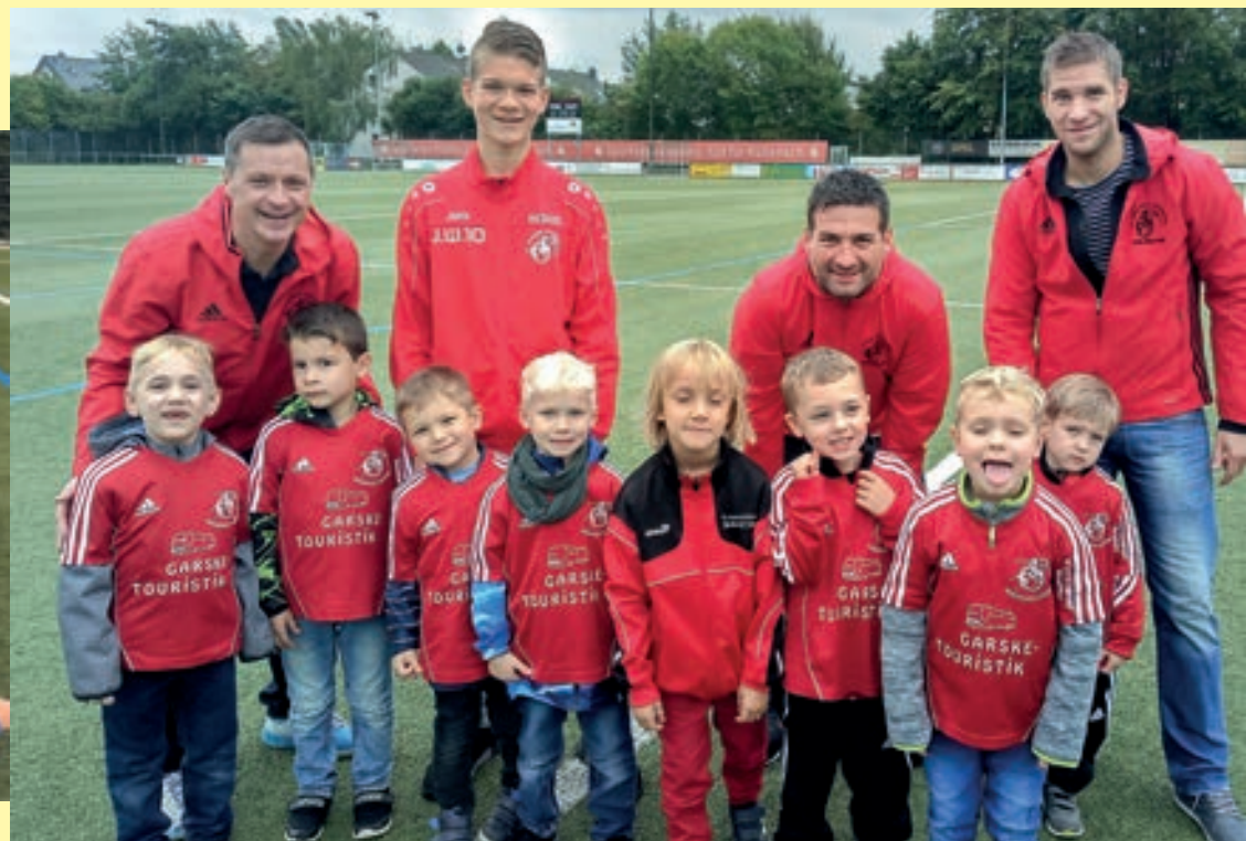
Die Bambinis nach dem Rübenaacher Kirmesumzug

weise eine "modische Erstausrüstung" in Form von einheitlichen Trainingsjerseys oder -anzügen, würden wir uns über weitere Sponsoren, welche die Arbeit mit den Kindern unterstützen möchten, sehr freuen. Bei Interesse kann man das Trainerteam jederzeit gerne ansprechen.