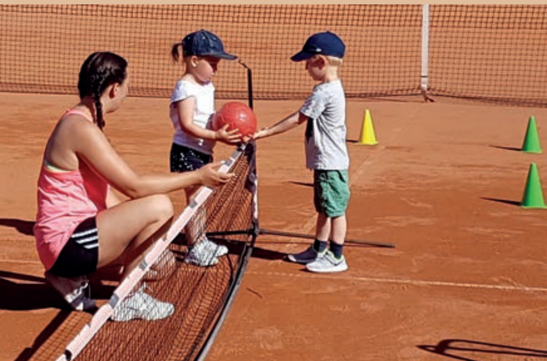
Ballschule mit 3jährigen Kindern auf der Tennisanlage in Rübenach