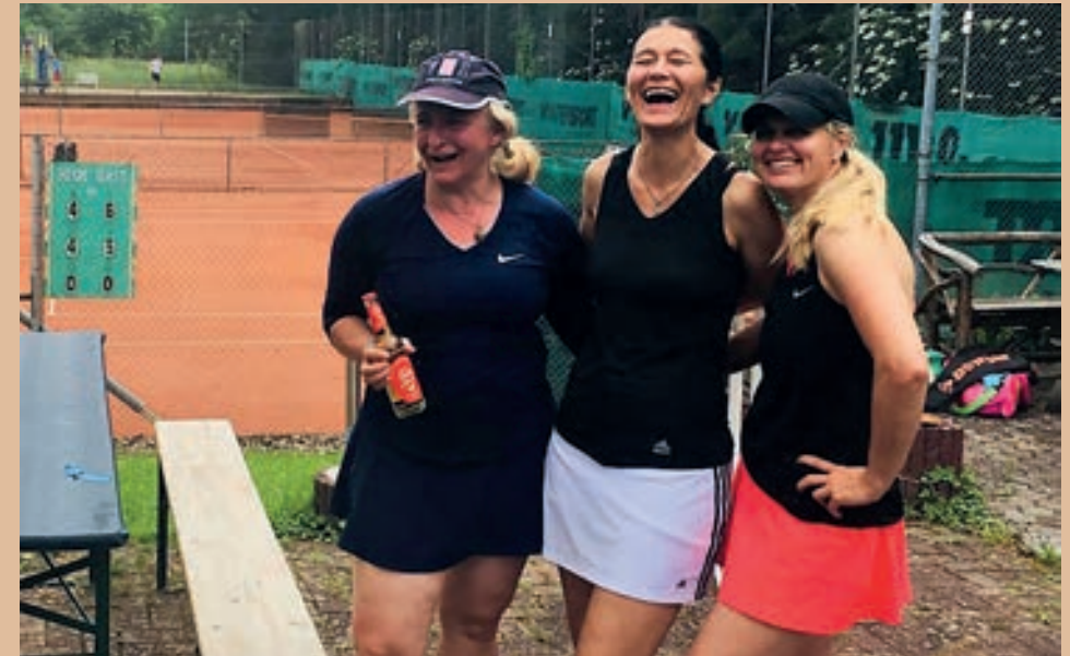
Damen 30 – Mannschaft des FV „Rheingold“ Rübenach.