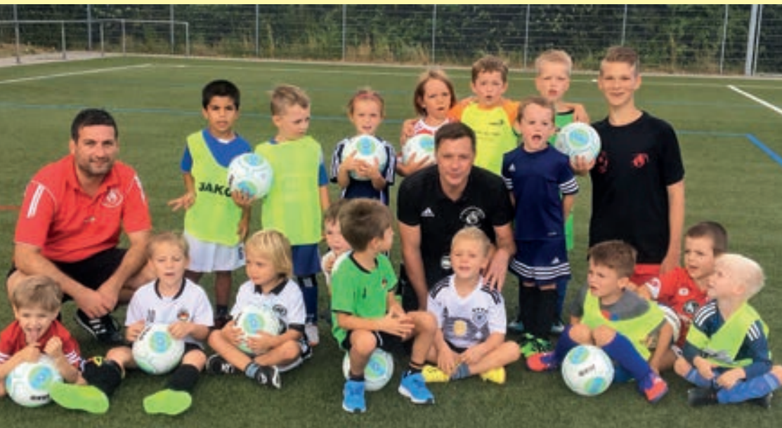
Erstes Training mit gespendeten Bällen

Gut vorbereitet durch die ersten Eindrücke, welche die Kinder bereits beim Mini-Training in der Sporthalle sammeln konnten, beginnen derzeit viele Nachwuchskicker aufgeregt und neugierig ihre Fußballkarriere auf dem Rübenaacher Kunstrasenplatz. Die Bambinis umfassen die Jahrgänge 2012/2013 und sind somit die jüngsten Stars des FV Rheingold Rübenaach.