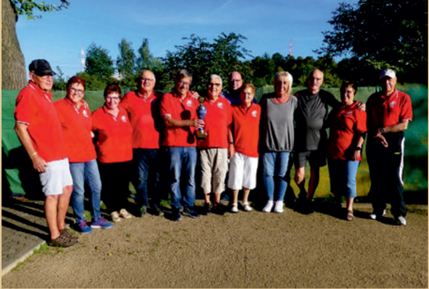
Die Boule-Gruppe vom FV Rheingold Rübenach