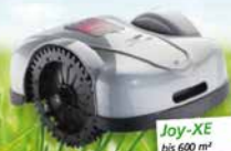
Joy-XE bis 600 m 2