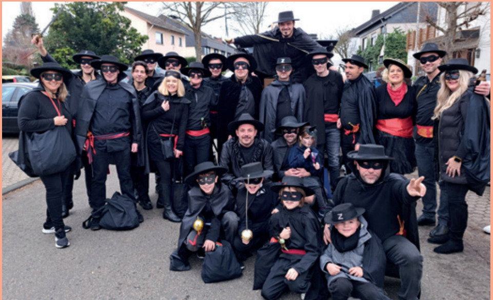
Fußgruppe der Alten Herren Mannschaft des FVR