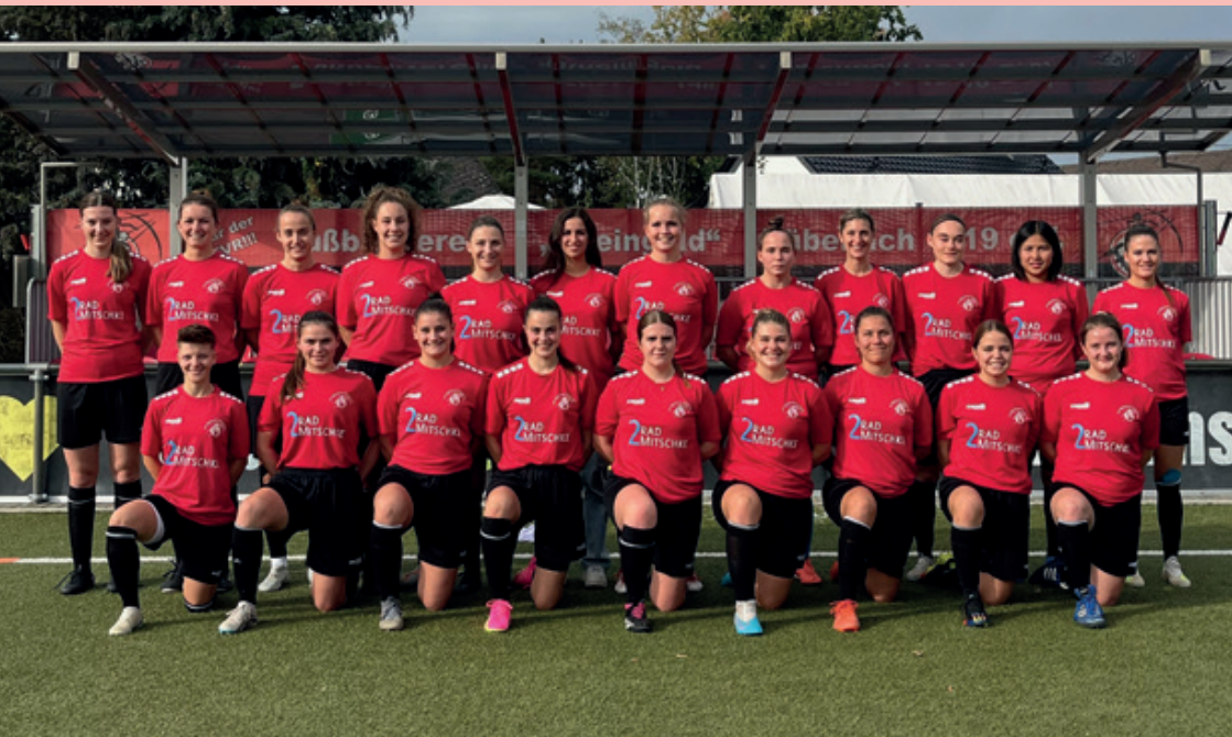
1.Frauen-Mannschaft des FV Rübenach in der Saison 2023/2024