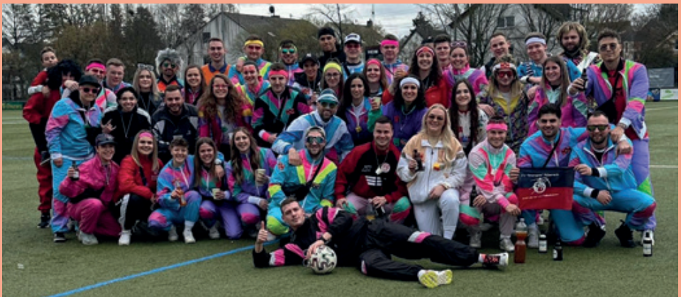
Fußgruppe der Frauen- und Herrenmannschaften des FVR

Endlich konnte sich nach dem letzten Umzug 2020 und Ausfall des Zuges im Jahr 2022 durch die Corona-Pandemie, wieder ein närrischer Lindwurm durch die Straßen Rübenachs schlängeln.